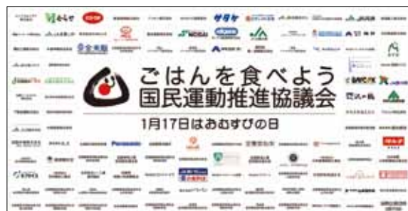
ごはんを食べよう国民運動PRパネル