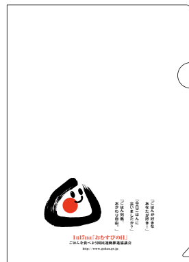
クリアフォルダー